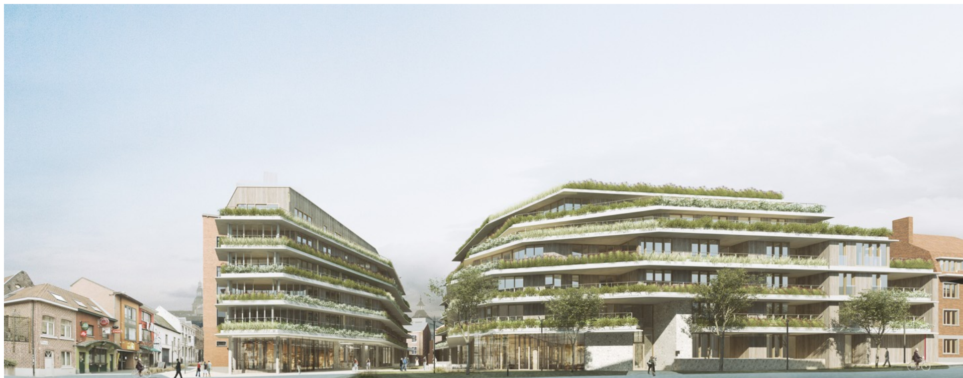
Er komen 54 flats, 37 assistentiewoningen, 30 studentenkamers en duizend vierkante meter commerciële ruimte voor horeca en handel op de site van het RTT-gebouw.

‘Groene kloof’ tussen gebouwen zal Molenpoort verbinden met Begijnhof